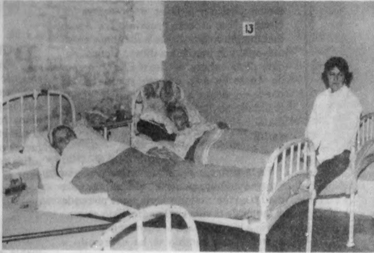
Sala de Ginecología, Hospital Pereira Rossell